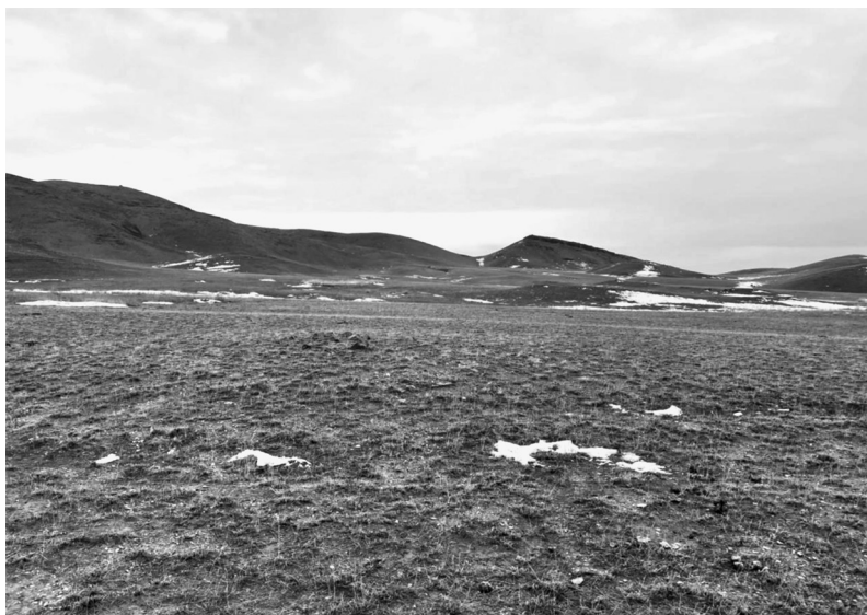
Қарабастау өңіріндегі бандитсай